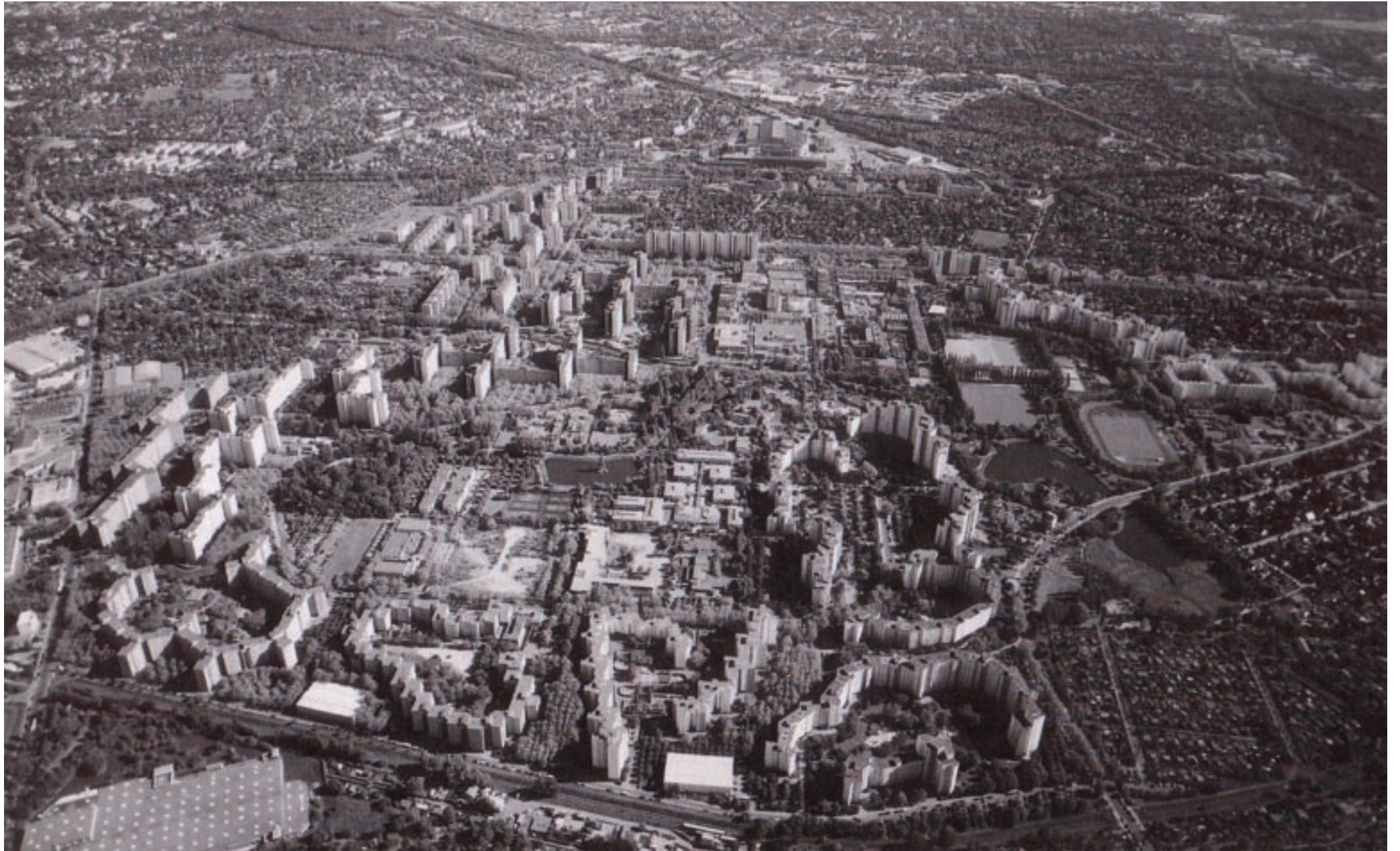
Märkisches Viertel, Luftbild 2004